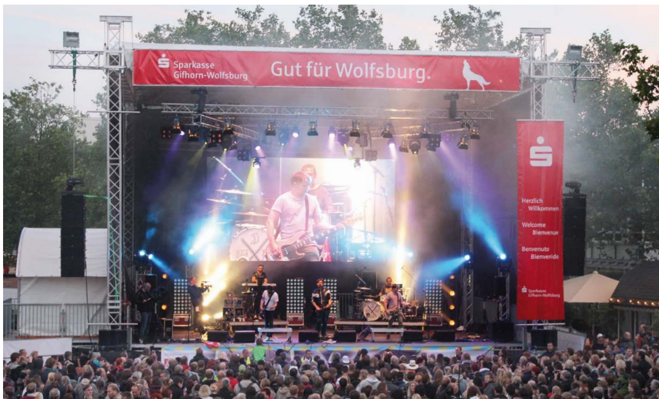
Jupiter Jones auf der Hauptbühne – 75 Jahrfeier in Wolfsburg

modernsten Geräte von führenden Unternehmen. Hier hört unser Qualitätsanspruch allerdings noch nicht auf. Ein perfektes Event gelingt nur bei optimaler Organisation und Durchführung. Dafür stehen wir BELI-Mitarbeiter unseren Kunden stets zur Verfügung. Wir definieren mit Ihnen zusammen das benötigte Material und beraten gern bei der Auswahl. Zudem organisieren wir den Aufbau und Abbau und begleiten Sie bei der Durchführung der Veranstaltung. Unser Know-how und die Liebe zur Perfektion treiben uns dabei immer an das bestmögliche Ergebnis für unsere Kunden zu erreichen. Jährlich bieten wir zudem ein bis zwei neue Lehrstellen an, um unseren Anspruch und unsere Liebe zur Qualität an die nächste Generation weiter zu geben.