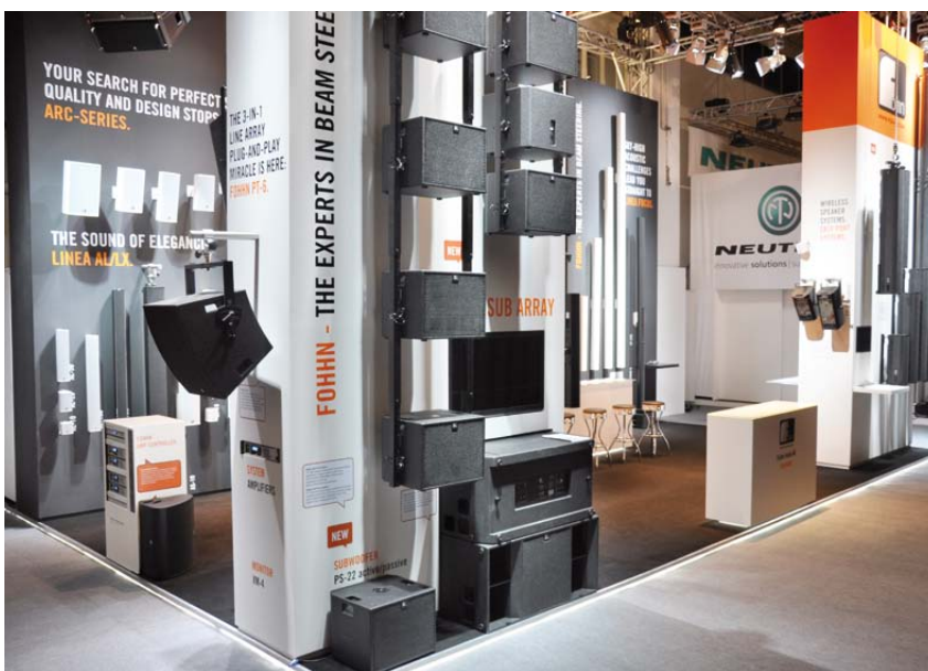
Messestand der Fohhn AG – Pro Light and Sound 2013

Unseren Qualitätsanspruch übertragen wir selbstverständlich auch auf die Auswahl unseres Materials. Wir verwenden ausschließlich modernste Produkte der Beschallungs-, Konferenz- und Lichttechnik, sowie des Bühnenbaus und der Großbildprojektion.